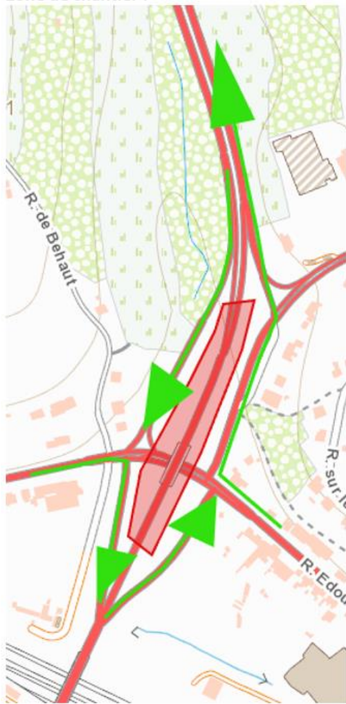
Zone de chantier :